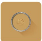
India Yellow No. 66