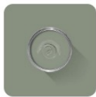
Card Room Green No. 79