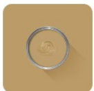
Duster No. 319